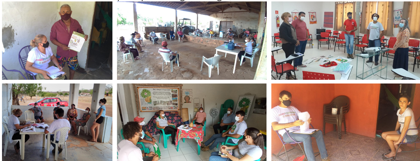
Momentos de reunião e visitas aos assentamentos - Projeto de Assistência Técnica e Extensão Rural

Nessa parceria a AEFAJA assumiu compromisso de apoiar ações nos Assentamentos Lagoa Grande II, Groelândia, Charneca e Donato. Ressaltamos a importância desse projeto para enfrentar os desafios que a Agricultura Familiar Camponesa vem passando e afirmando nossas ações em defesa da vida através dos princípios da Agroecologia, Economia Solidária e Bem Viver.