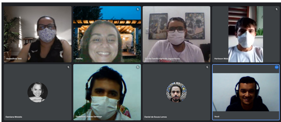
Diaconia - Escritório Umarizal/RN. 09/11