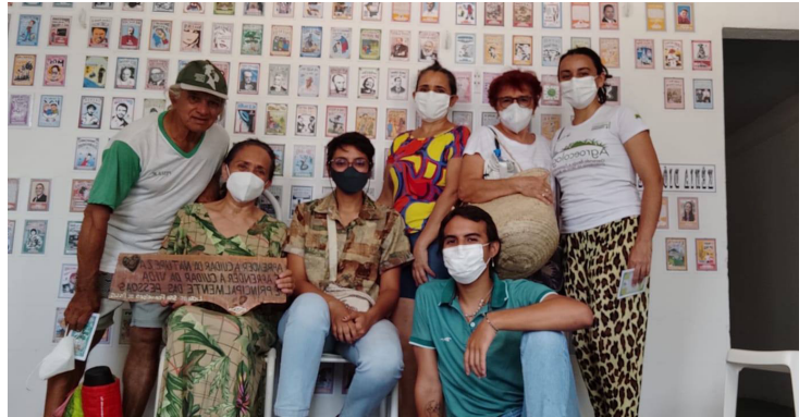
Casa do Cordel de Tabuleiro do Norte, em 03 de outubro de 2021