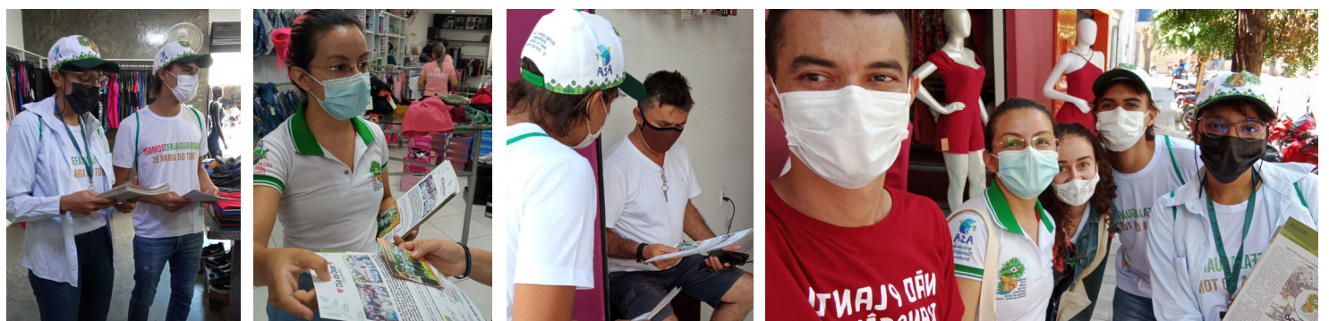
Dia de Doar - Mobilização no centro de Tabuleiro do Norte, em 30 de novembro de 2021