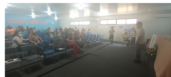
Secretaria de Educação de Alto Santo, em 28 de setembro de 2021