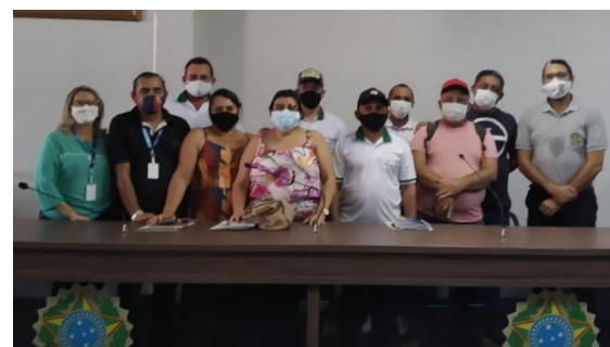
Câmara Municipal de Alto Santo, em 22 de julho de 2021.

INSCRIÇÕES - 16 de agosto à 05 de novembro de 2021 https://efajaguaribana.org.br/selecao-3-turma