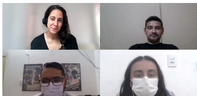
Laudes Foundation, em 09/12