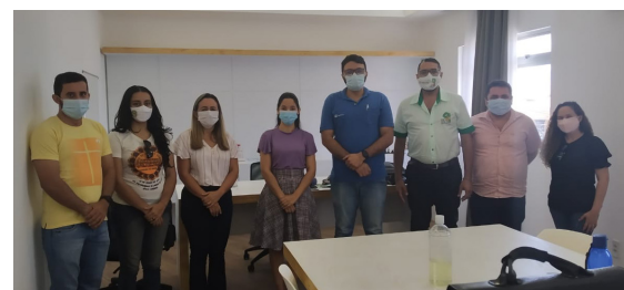
Prefeitura Municipal de Ibicuitinga, em 10 de agosto de 2021