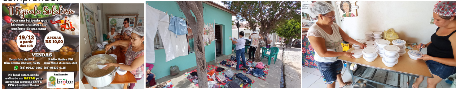
Escritório da AEFAJA no centro de Tabuleiro do Norte. Feijoada e Bazar Solidários, em 19 de dezembro de 2021

No dia 19/12 a AEFAJA realizou, junto com o Instituto Brotar, a II Feijoada e Bazar Solidários. Este ano fizemos no formato de entrega a domicílio. Todo o recurso obtido com as vendas da Feijoada e do Bazar são para ajudar a custear as despesas mensais das duas organizações. Nós agradecemos a todas e todos que contribuíram na construção desse momento, à quem pode doar algum alimento ou item para venda no bazar, bem como às pessoas que puderam ajudar comprando.