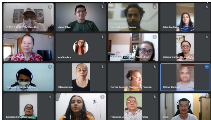
Encontro com COMSEAs, em 23 de julho de 2021

Na sexta-feira, 23/07, o Projeto Sementes da Vida possibilitou o encontro em uma reunião virtual com os Conselhos Municipais de Segurança Alimentar e Nutricional – COMSEAs de alguns municípios do Vale do Jaguaribe. Estiveram presentes representantes dos municípios de Aracati, Russas, Palhano, São João do Jaguaribe, Fortim, Tabuleiro do Norte e representação do Conselho Estadual de Segurança Alimentar e Nutricional – CONSEA.