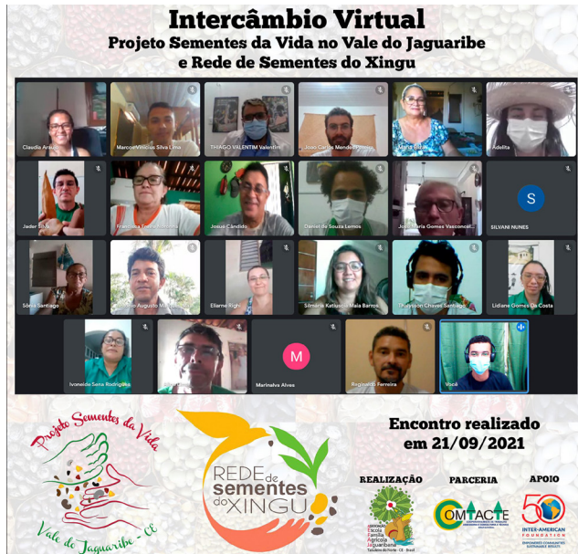
Encontro com Rede de Sementes do Xingu, em 21 de setembro de 2021

A Rede de Sementes do Xingu é uma rede de trocas e encomendas de sementes de árvores e outras plantas nativas das regiões do Xingu. Surgiu em 2007 a partir do crescimento da demanda por sementes para plantios de restauração na região. Formada por grupos de famílias agricultoras, indígenas e coletores urbanos. O intercâmbio possibilitou que pudéssemos conhecer como a Rede funciona e inspirar a nossa realidade do Projeto Sementes da Vida, que vem caminhando na construção e fortalecimento das sementes crioulas no Vale do Jaguaribe.