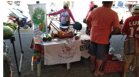
1ª Feira Agroecológica da Reforma Agrária e Agricultura Familiar do Baixo Jaguaribe. Limoeiro do Norte - CE, 26 de novembro de 2021