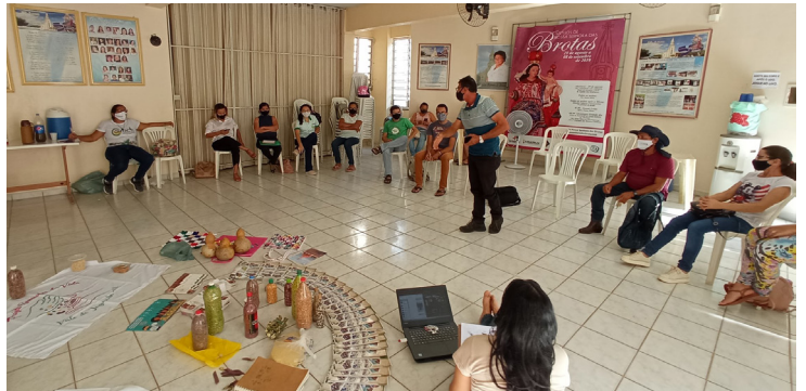
Salão Paroquial. Tabuleiro do Norte - CE, em 30 de julho de 2021