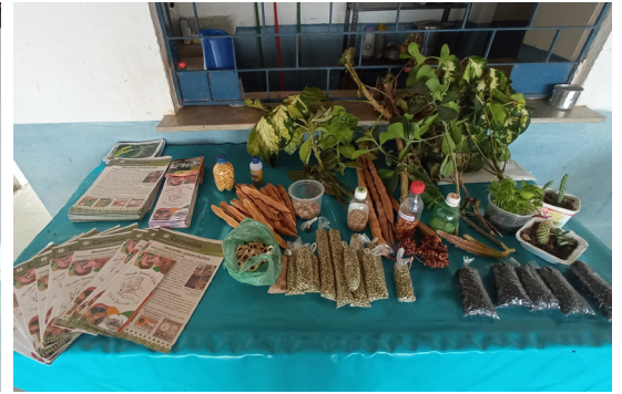
Croatá de Cima - Limoeiro do Norte - CE, 15 de dezembro de 2021