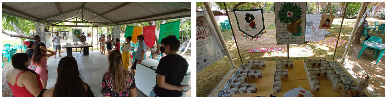
Confraternização da Associação Escola Família Agrícola Jaguaribana - AEFAJA, em 05 de dezembro de 2021

No domingo, dia 05/12, a Associação Escola Família Agrícola Jaguaribana – AEFAJA realiza um momento de confraternização de fim de ano. Na ocasião, foram apresentados, para os presentes, um pouco dos projetos que vêm sendo desenvolvidos, tais como: o Projeto Sementes da Vida no Vale do Jaguaribe, a Escola de Música Sons da Terra, o projeto de Assistência Técnica e Extensão Rural – ATER, e a Escola Família Agrícola (EFA) Jaguaribana Zé Maria do Tomé. Que o ano de 2022 venha com luz e cheio de saúde para todas e todos estarmos fortes para as lutas e vitórias que virão!