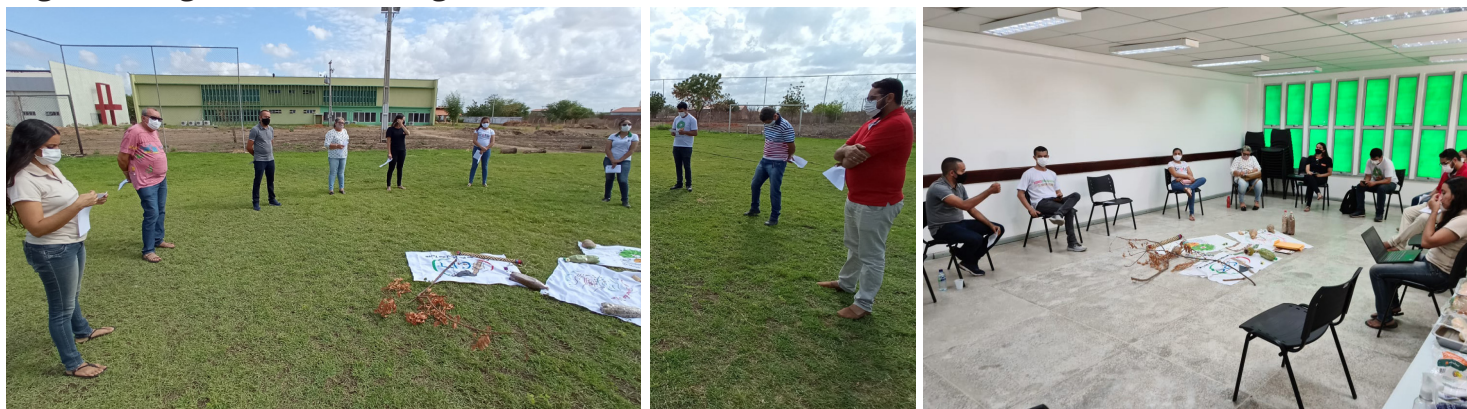
IFCE Campus Tabuleiro do Norte - CE, 26 de novembro de 2021

A AEFAJA apresentou o Projeto Sementes da Vida no Vale do Jaguaribe, que está implantando 16 Casas de Sementes na região do Vale, e é realizado em parceria com a COMACTE. O Instituto Brotar com o Projeto Comunidades Vivas, falou sobre a implantação das tecnologias sociais BioÁgua e Biodigestor no município de Tabuleiro do Norte. E a CPT/Mossoró apresentou os projetos que vem sendo desenvolvidos no Rio Grande do Norte com implantação de tecnologias sociais, como fogão ecológico e reuso de águas cinzas, dentre outras.