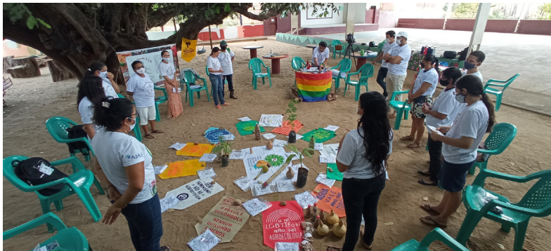
Tabuleiro do Norte - CE, em 27 de novembro de 2021