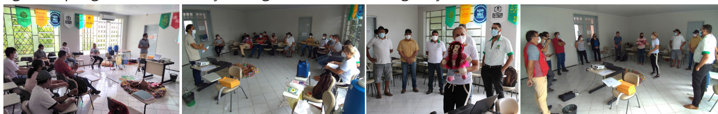
04/11. Secretaria Municipal de Meio Ambiente - Tabuleiro do Norte - CE

A reunião teve o objetivo de apresentar o Projeto de Assistência Técnica e Extensão Rural - ATER e ainda dialogar sobre demandas dos assentamentos. Acreditamos no fortalecimento dos Assentamentos da Reforma Agrária através da organização comunitária, estimulando a produção agroecológica para proporcionar a segurança e soberania alimentar e lutando por uma reforma agrária que garanta as condições dignas de trabalho e geração de renda.